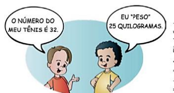
Ilustração: Ana Rita da Costa

FELIPE E DAVI USAM NÚMEROS PARA REGISTRAR INFORMAÇÕES SOBRE ELES. FAÇA VOCÊ TAMBÉM.