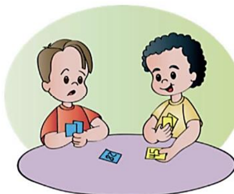
Ilustração: Ana Rita da Costa